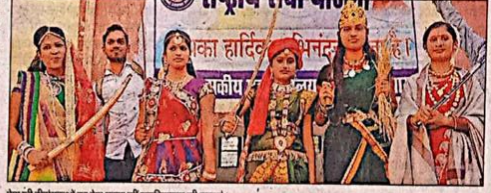
देश की वीरगनाओं का देश धारण की महाविद्यालय की छात्रा।