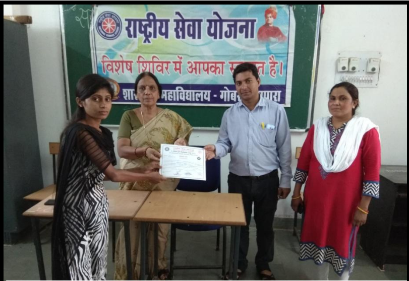
Date 17-07-2018 NSS Certificate Vitran